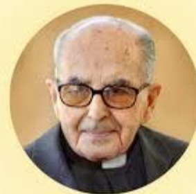
Co-iniciador del Movimiento de Cursillos de Cristiandad